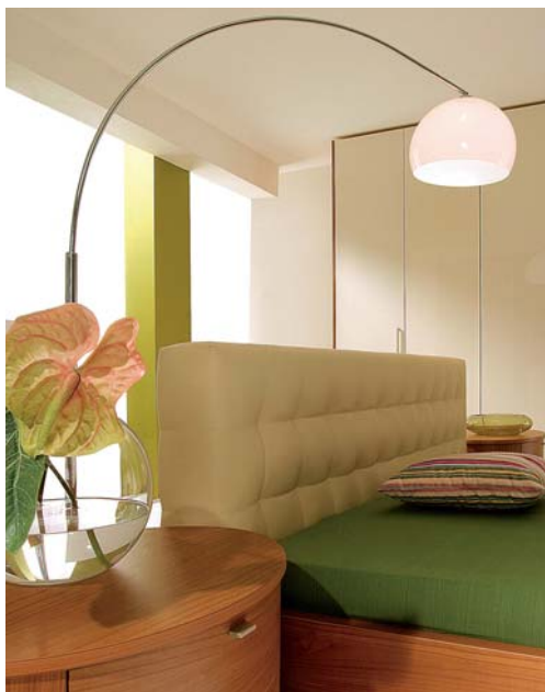
Aurora, rozmer rámu 180 x 200 cm, cena od 616 € (18 558 Sk). Rám wenge alebo čerešňa, čelo z ekokože v smotanovej alebo bordovej farbe, ID Point, predáva Nábytok Galan