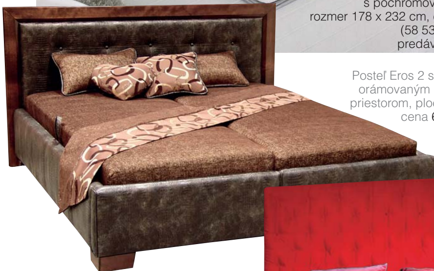
Posteľ Eros 2 s čalúneným čelom orámovaným drevom a úložným priestorom, plocha 180 x 200 cm, cena 677 € (20 395 Sk), Fines