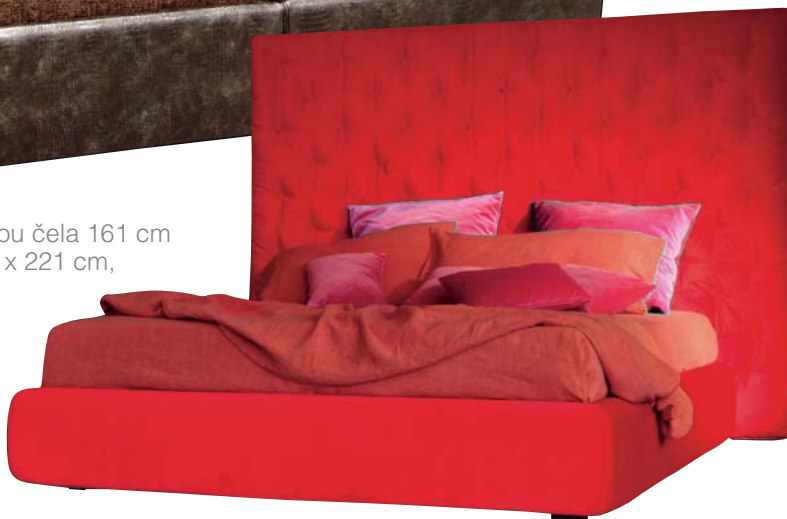
Posteľ Wing s výškou čela 161 cm a rozmermi od 172 x 221 cm, s možnosťou úložného priestoru, cena od 2 971 € (89 504 Sk), Bonaldo, predáva Sedya