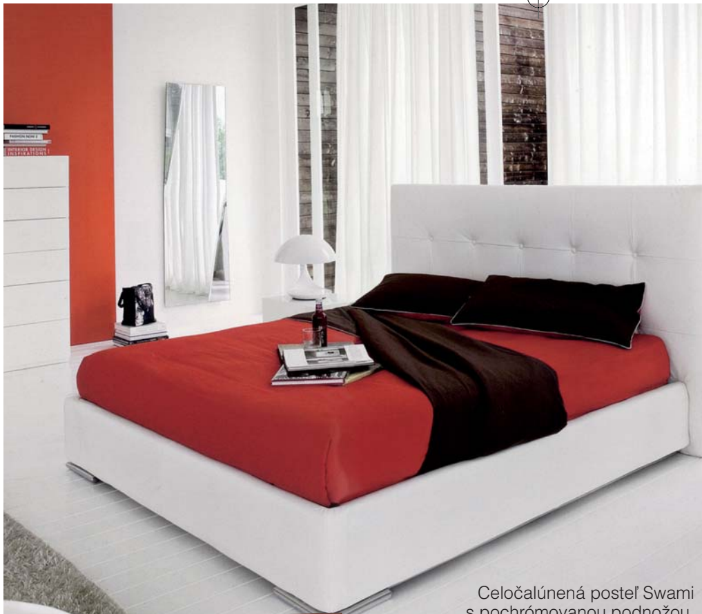
Celočalúnená posteľ Swami s pochrómovanou podnožou, rozmer 178 x 232 cm, cena od 1 943 € (58 535 Sk). Calligaris, predáva Ekoma design