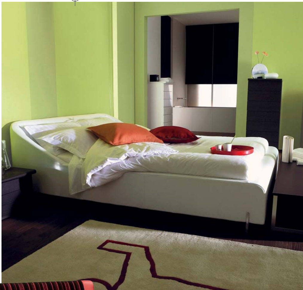
Posteľ Snowdonia je k dispozícii v 2 veľkostiach, 176 x 225 cm a 196 x 225 cm. Cena od 2 222 € (66 940 Sk), Ligne Roset, predáva architekti Jančina